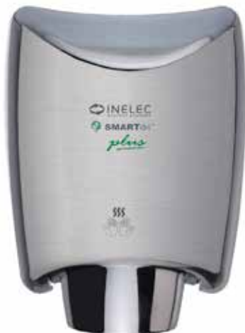
Acero inoxidable satinado CÓDIGO: 1401K973P2