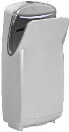
Pearl White CÓDIGO: 41014000